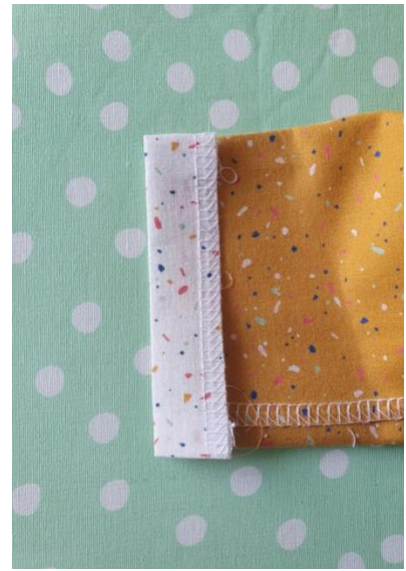
Replier la pièce extérieure par-dessus les 2 autres.

13. Coudre le rabat (blanc) de manière à prendre toutes les épaisseurs : tissu extérieur et intérieur. Vous venez de former les 2 coulisses.