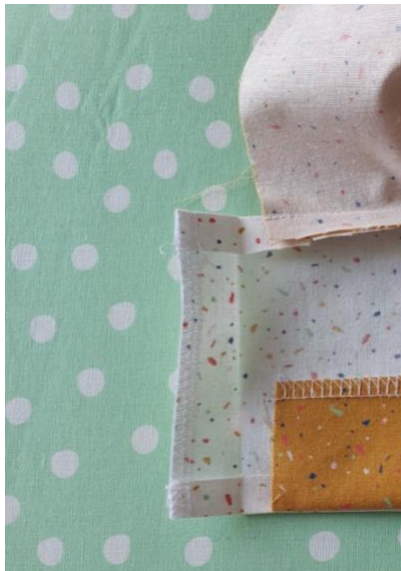
Replier la pièce du bas