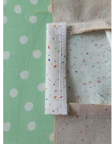
Replier le bord du tissu extérieur sur le cran, et marquer le pli au fer