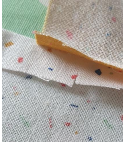
Repérer les crans sur la pièce extérieure