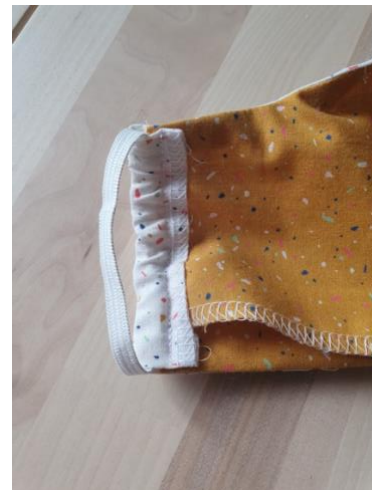
Cacher le nœud dans la coulisse