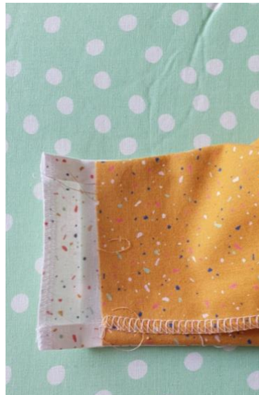
Rabattre la pièce du haut par-dessus