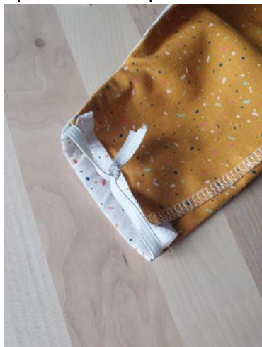
Faire un noeud

19. Passer des élastiques dans les coulisses. Pour la longueur : elle doit vous permettre de passer l'élastique derrière vos oreilles sans vous faire mal.