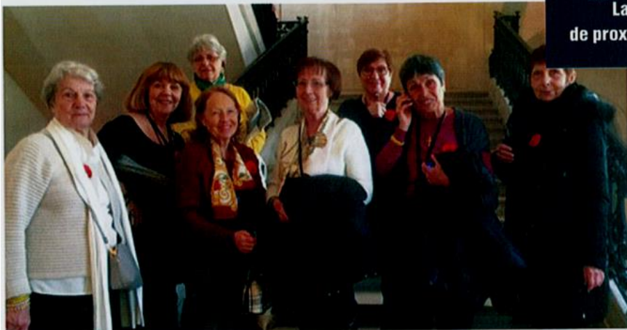
Une partie des équipières niçoises à Paris pour les 400 ans de l'association, le 8 mars dernier.

Le Mas Saint Vincent à Antibes. Depuis 15 ans, les membres de l'Équipe Saint-Vincent d'Antibes effectuent un travail formidable auprès de femmes victimes de violences conjugales, pour les aider à se reconstruire, trouver un emploi et un logement indépendant. Les besoins sont énormes et la liste d'attente ne cesse de s'allonger. La structure actuelle permet de recevoir des femmes seules ou avec enfants, envoyées par les services sociaux, pour une durée de trois mois renouvelable une fois. Le fonctionnement de cette structure, ouverte 24h sur 24, 7 jours sur 7, nécessite, outre les 6 équipières et les nombreux bénévoles, des salariés. L'aide apportée à ces femmes doit leur permettre de retrouver travail, logement et de repartir dans la vie. Pour cela, elles participent à des ateliers d'art thérapie, de soutien scolaire et de remise à niveau pour les résidentes d'origine étrangère. Depuis janvier dernier, des travaux de réhabilitation d'une maison jouxtant le foyer actuel sont en cours. Ils vont permettre de créer deux appartements supplémentaires pour accueillir, dès juillet de cette année, des femmes avec plusieurs enfants et deux studios d'hébergement d'urgence. L'actuelle présidente de l'Équipe Saint-Vincent d'Antibes est Danielle Boyer.